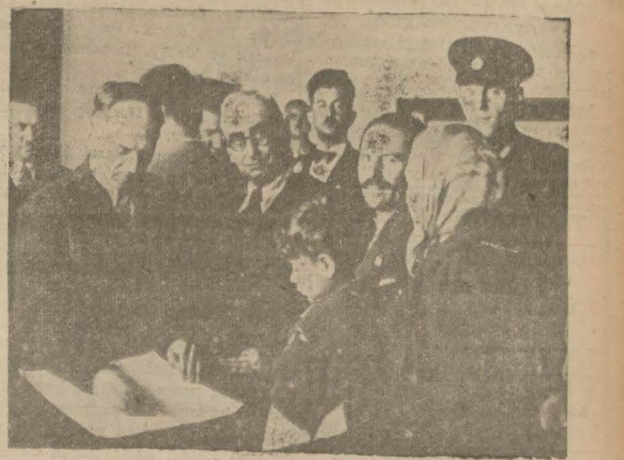
Kızılay memurları felâketzedeleri tesbit ediyorlar. Fener, patrikhanesinden çıkan ve 94 felâketi etrafında adliye ve polis mahallin kâmilan yanması, 476 vatandaşın kamları dün de tahkikata ehemmiyetle açıkta kalmakla neticelenen yangın (Devamı 2 inci sayfada)

Felâketzedelere sıcak yemek, yatak, yorgan dağıtılıyor, ayrıca bir aylık iâşe ve mesken bedelleri de verilecek