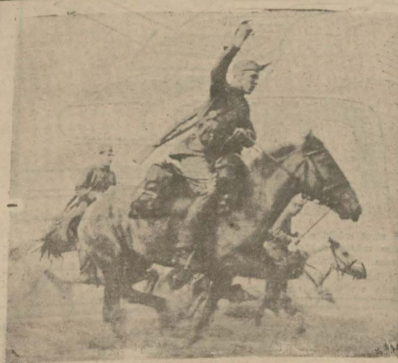
Rus süvarisi bir hücum esnasında

«Son Posta» nun da'mi ve her diyel bulmacalarının ikinci devresine aid cevap yollama müddeti bugün bitmiştir. Bugünden itibaren gelen cevaplar tekkik edilmediği ve necece yakın da ifan olunacaktır.